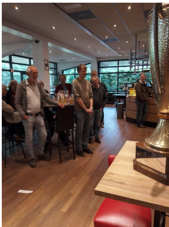
Prijsuitreiking bij de Nederlandse Bridgebond