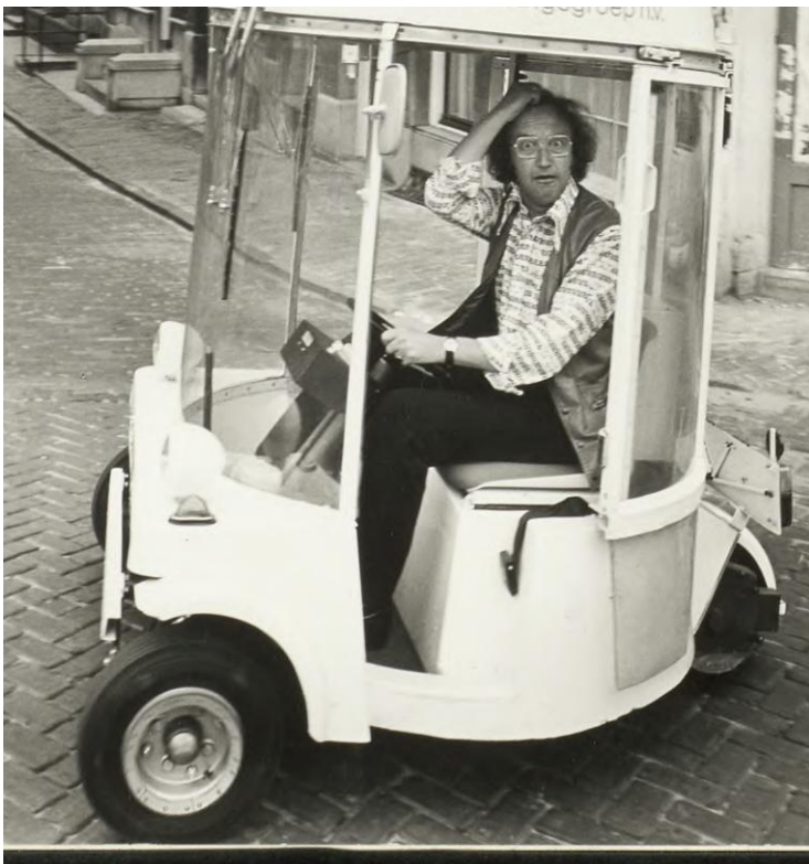
IJf Blokker, 1930-2026

Andere geveugelde citaten van Blokker zijn ‘Pollens!’, ‘Als het ware’ en ‘Ik wordt een peu nerveu’. Later vertelde Blokker dat hij liever niet aan zijn fameuze personage herinnerd wilde worden en speelde hij nog maar sporadisch voor tv. Op latere leeftijd was hij actief bij de lokale omroep van Den Helder.