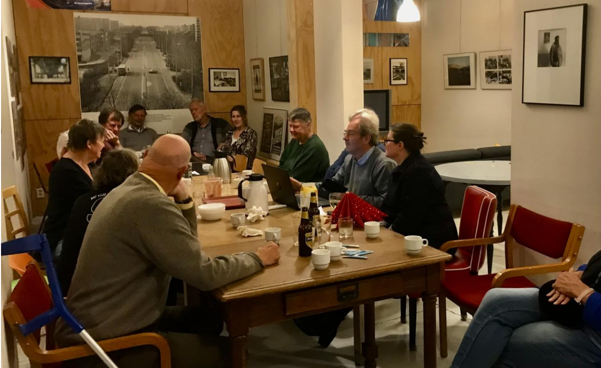
Uitje voor vrijwilligers en bestuurders, 8 november 2025