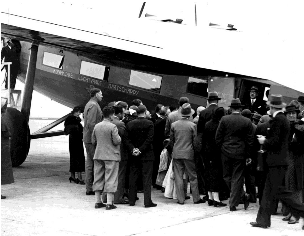
Aankomst van de Amerikaanse topspeler Ely Culbertson op Schiphol, 1935